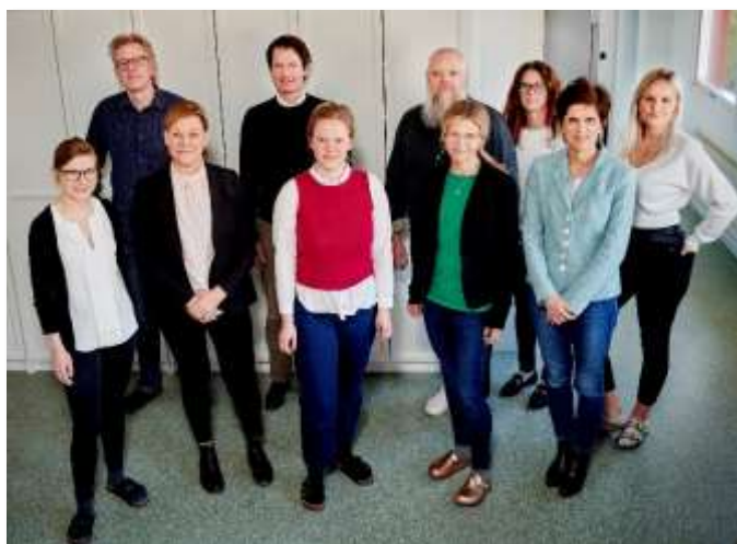
Delar av teamet på Corline – leveransförmåga av både produkter och avancerad kunskap

Förutom fysiska leveranser har fokus de senaste 3-6 månaderna varit att stödja de regulatoriska aktiviteterna hos våra kunder och leverera det kunskapsinnehåll de behöver i sina lanseringsprocesser och respektive dialoger med myndigheter. Här visar Corline återigen styrka i sin organisation där den djupa kunskap teamet besitter vad gäller immuntrombos och heparinytor, är helt avgörande för att kunderna skall kunna integrera CHS™ på sina produkter. Vi har under det senaste 6 månaderna också väsentligt stärkt organisationen inom kvalitetsområdet, vilket är en förutsättning för att Corline skall kunna agera leverantör i medicintekniksegmentet, såväl under utveckling som efter lansering.